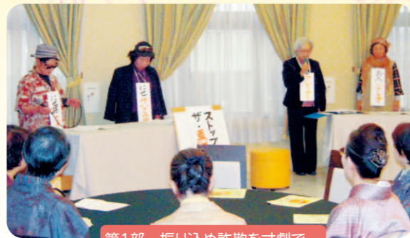
第1部 振り込め詐欺を寸劇で…