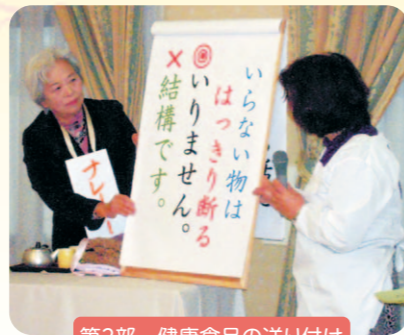
第2部 健康食品の送り付け