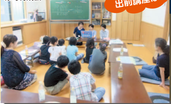
消費生活サポーターの出前講座は