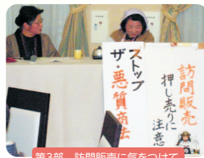
第3部 訪問販売に気をつけて

ラポート十日町で開かれた「きものの集いの会」におじゃましました。35名の参加者の皆さんは素晴らしい和服姿。優雅な雰囲気の中で「悪質商法被害防止の講座を?」と思いましたが、雰囲気負けずに、衣装や小道具などをうまく利用して、参加者が飽きないよう4部構成の寸劇①振り込め詐欺 ②健康食品の送り付け ③訪問販売 ④利殖商法)を行い、最後に全員で「絶対だまされないぞ!」の合言葉の合唱をしました。寸劇は、ストーリーやセリフがよく考えられていて、理解しやすく、最後には、参加者自ら、自分に起きた事例を発表して、対処方法についての説明をするなど盛り上がりました。(編集委員 奥山浅治)