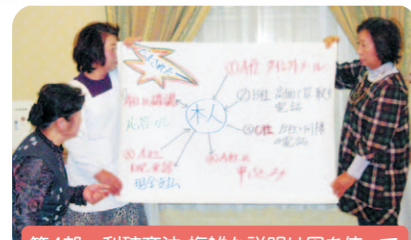
第4部 利殖商法 複雑な説明は図を使って

ラポート十日町で開かれた「きものの集いの会」におじゃましました。35名の参加者の皆さんは素晴らしい和服姿。優雅な雰囲気の中で「悪質商法被害防止の講座を?」と思いましたが、雰囲気負けずに、衣装や小道具などをうまく利用して、参加者が飽きないよう4部構成の寸劇①振り込め詐欺 ②健康食品の送り付け ③訪問販売 ④利殖商法)を行い、最後に全員で「絶対だまされないぞ!」の合言葉の合唱をしました。寸劇は、ストーリーやセリフがよく考えられていて、理解しやすく、最後には、参加者自ら、自分に起きた事例を発表して、対処方法についての説明をするなど盛り上がりました。(編集委員 奥山浅治)