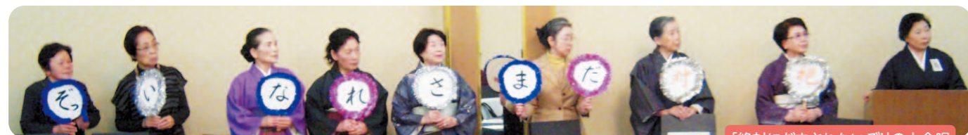
「絶対だまされないぞ!」の大会唱